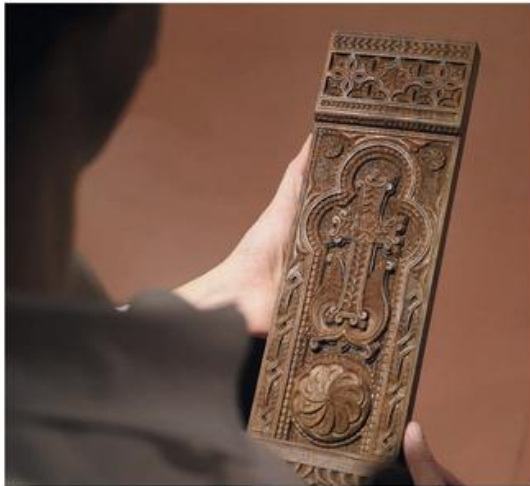
Un simple khatchkar, quelques valises et un doudouk, fredonnant « À la claire fontaine » suffisent pour traduire le long périple des orphelins de Cousgoundjouk et leur ancrage en terre de France.