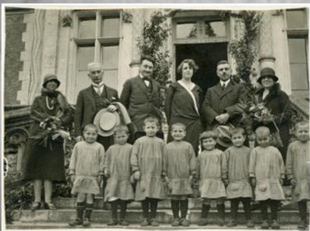
Des enfants et des employés de l'orphelinat de La Gaudinière

L'histoire incroyable d'un orphelinat arménien forcé à s'exiler dans la France de 1920, dévastée par la Grande Guerre. L'histoire d'un homme dont la volonté, l'abnégation et la générosité auront eu raison de la politique et des frontières.